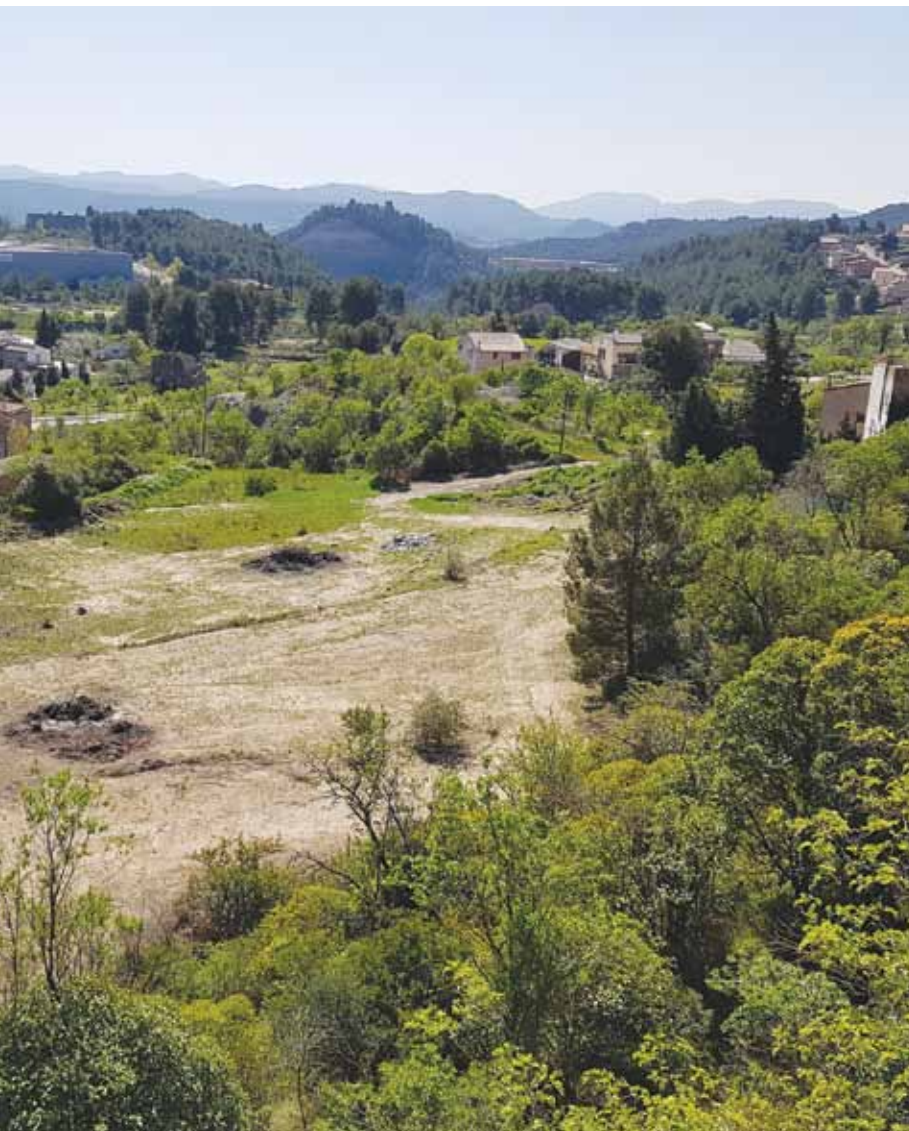
Vista dels terrenys per on passarà el nou vial d'accés al nucli antic