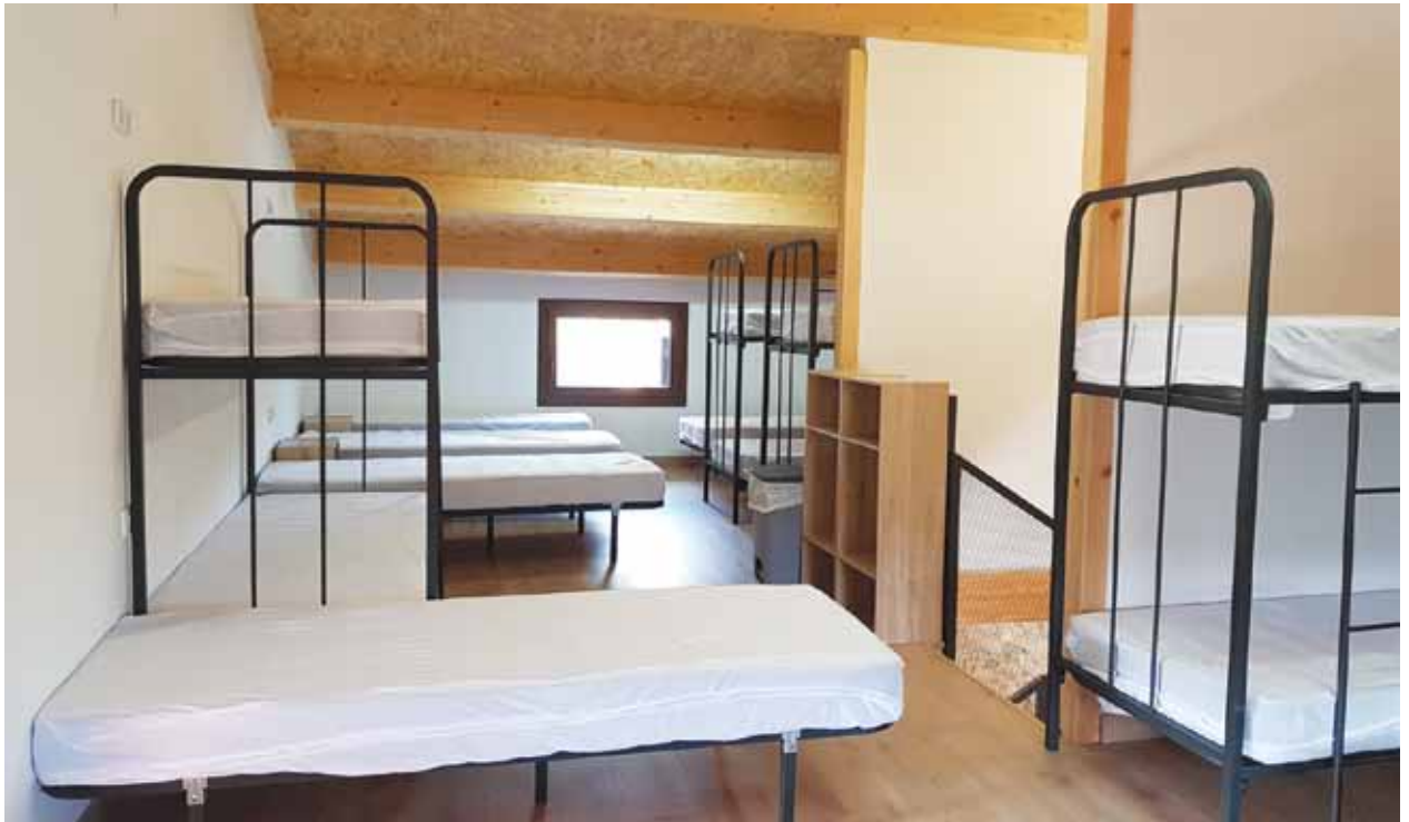
L'habitació disposa de llits individuals i lliteres per acollir els 18 hostes