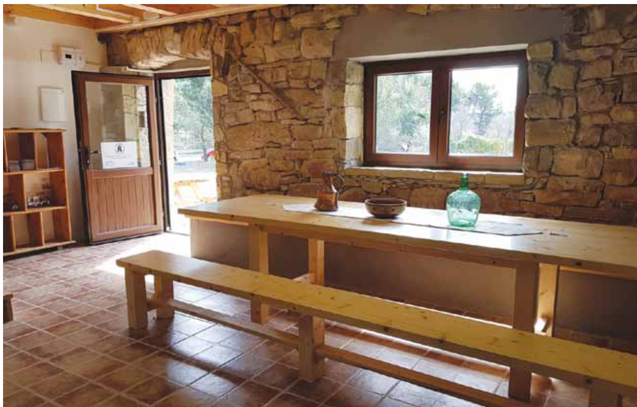
L'accés al refugi dona a un ampli menjador

· L'equipament té una capacitat per a 18 persones i va obrir portes a mitjan mes de març en ple Camí Ignasià