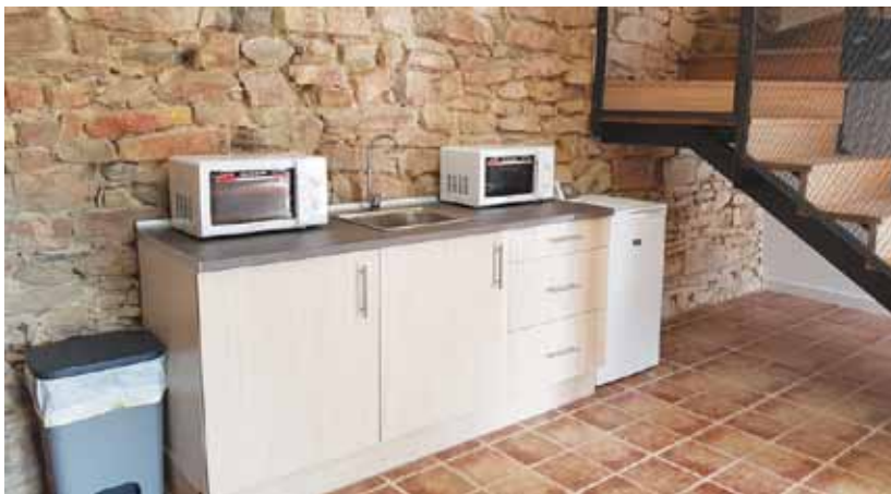
Espai per cuinar, amb microones i els utensilis necessaris

tocar de l'escola Sant Miquel i la piscina, una masia cedida fa dues dècades a l'Ajuntament.